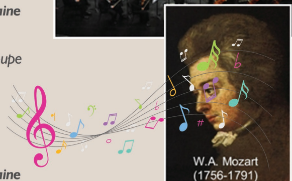
W.A. Mozart (1756-1791)